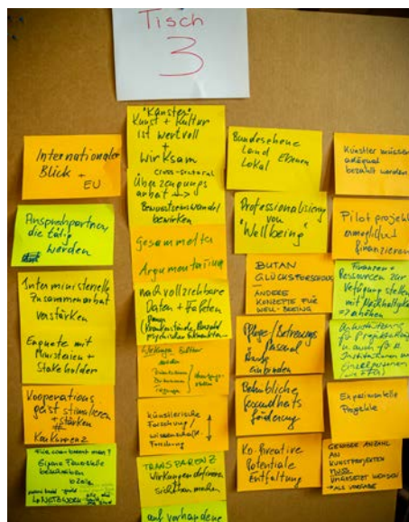
Flip-Charts bei der Veranstaltung "Arts for Health" am 5. Dezember 2019