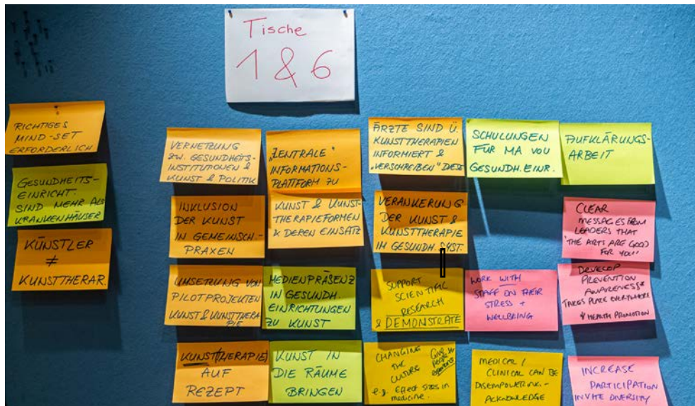
Flip-Chart bei der Veranstaltung „Arts for Health“ am 5. Dezember 2019