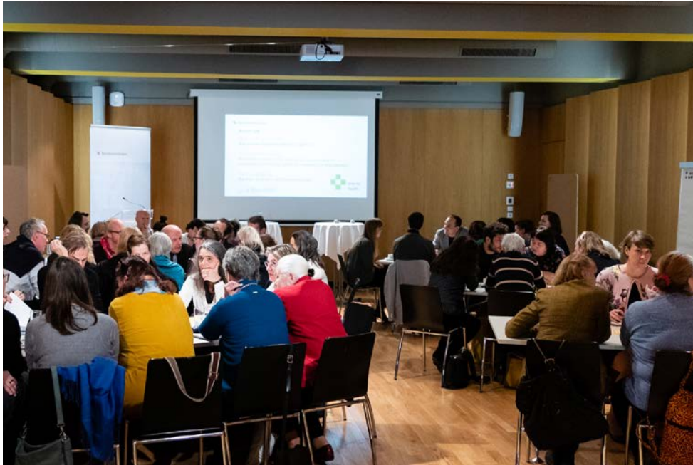
Diskussionen im World Café bei der Veranstaltung "Arts for Health" am 5. Dezember 2019